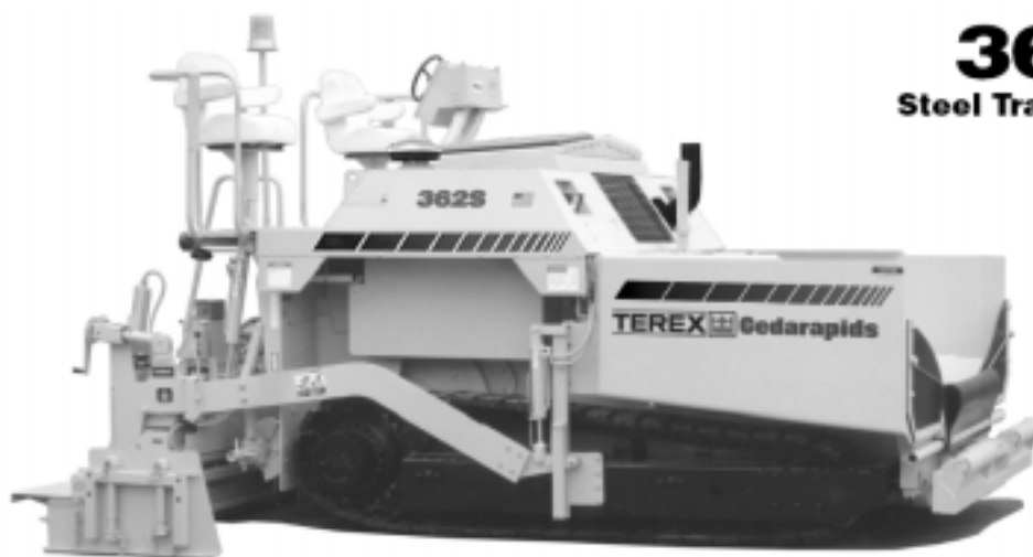
362S Steel Track Paver

ширина укладки (мин.) ..... 2,44 м ширина укладки (max.) ..... 5,5 м толщина укладки (max.) ..... 305 мм скорость укладки ..... 63 м/мин скорость движения ..... 9 км/ч